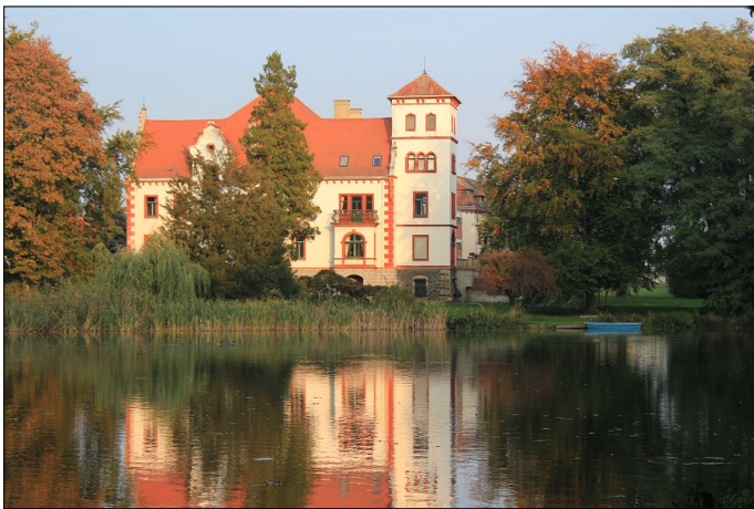
Schloss Thammenhain

Das Schloss Thammenhain war seit 1666 im Besitz der Familie von Schönberg bis zu deren Vertreibung 1945. Seit dem Jahr 2000 bewirtschaftet die Familie von Schönberg wieder das Schloss und bietet Ihnen Möglichkeiten für besondere Anlässe mit Festtafel im Saal oder Schlosspark sowie einem Trauraum.