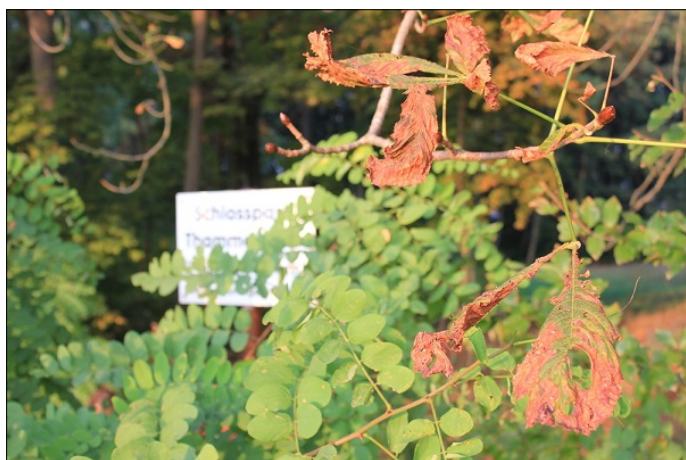
Schlosspark Thammenhain im Herbst 2013

Parkanlage mit Laubengang (gibt es insgesamt nur 3x in Sachsen), Ginkgo, Rhododendren, Linden, Blutbuche, Säuleneiche, Stieleichen, Schwarzkiefern, dem Magnolienbaum, Rot- und Hainbuchen, Ulmen, Eschen und Erlen.