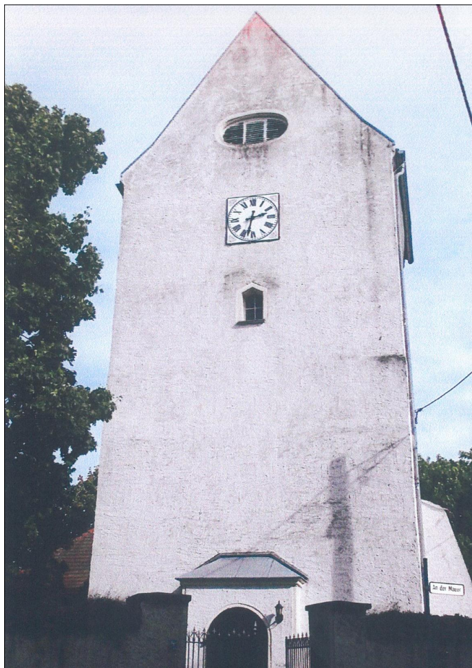
Die Kirche von Großzschepa