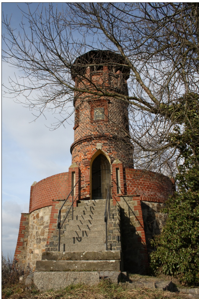
Aussichtsturm - Johannas Höh

Kleiner Aussichtsturm mit wunderschönem Blick nach Wurzen, Trebsen und zum Wermsdorfer Wald.